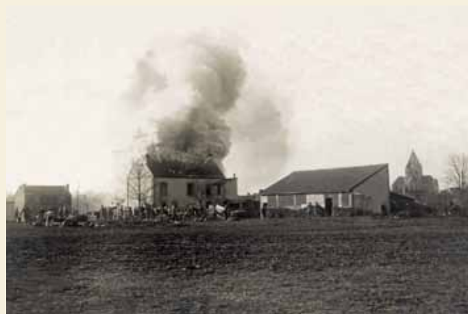
▲ « Lundi 22 nov. : [...] 1 h. La maison Tripette brûle. [...] »

Mercredi 29 Sept. : 6 h. matin, musiciens déjà là, enterrement 2 officiers derrière notre œil de bœuf. À 11 h. enterrement des soldats. »