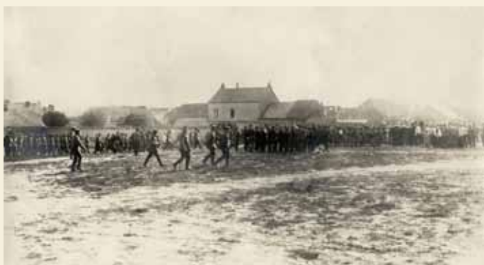
▲ À Guignicourt, près de 40% des inhumations de soldats allemands de l'année 1915 auront lieu au cours du seul mois de septembre. Ci-dessus, inhumation de 28 soldats à l'issue d'une offensive française dans le « nouveau » cimetière militaire aménagé à l'arrière de la ferme Farge-Savoie (parents de M me Camus-Farge), aux environs de l'actuelle rue des Fermes. Dans ce cimetière sont également inhumés des soldats français.

« Mercredi 15 Septembre : On reprend un carré pour allonger cimetièrre 15 enterrés ce soir, dont 14 du régiment du capitaine d'ici. [...] »