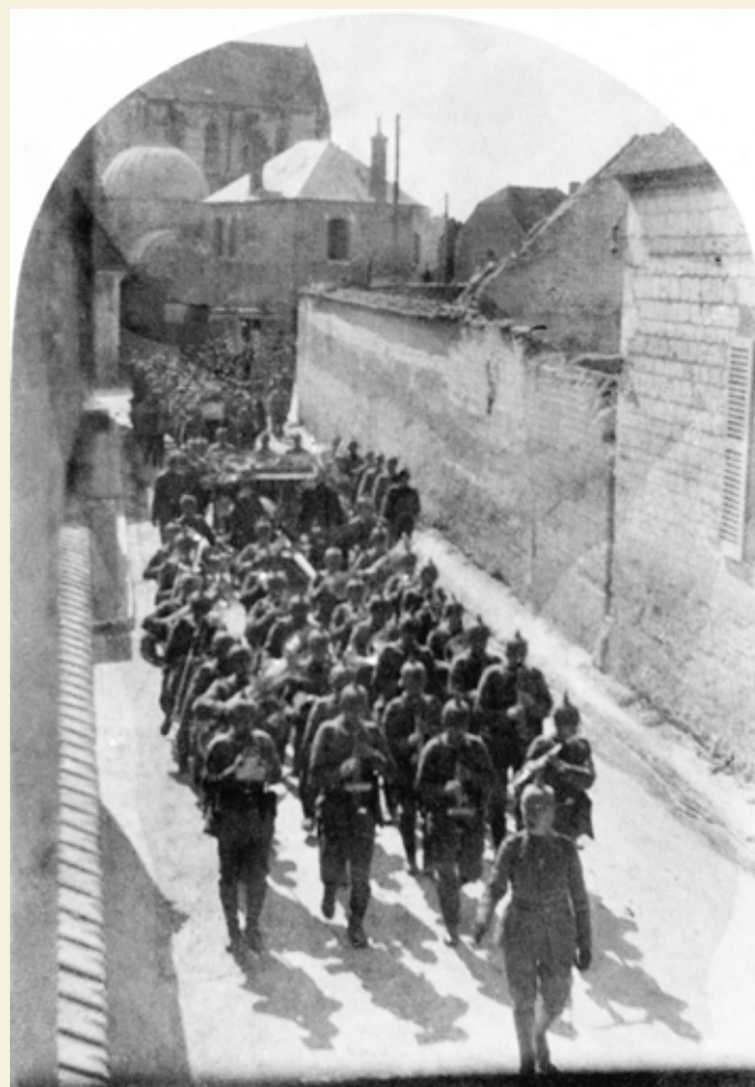
▲ « Dimanche 12 septembre : À 1 h allemande. Cérémonie plus lugubre qu'ordinaire. La musique funèbre accompagne 8 cercueils sur des chars, depuis la remise Pompe (1) jusqu'ici. [...] »

Datée du « 12.9.1915 », cette carte-photo allemande illustre la cérémonie mentionnée par M me Camus-Farge. Au fond, le caveau de la famille de Nazelle, la poste et l'église.